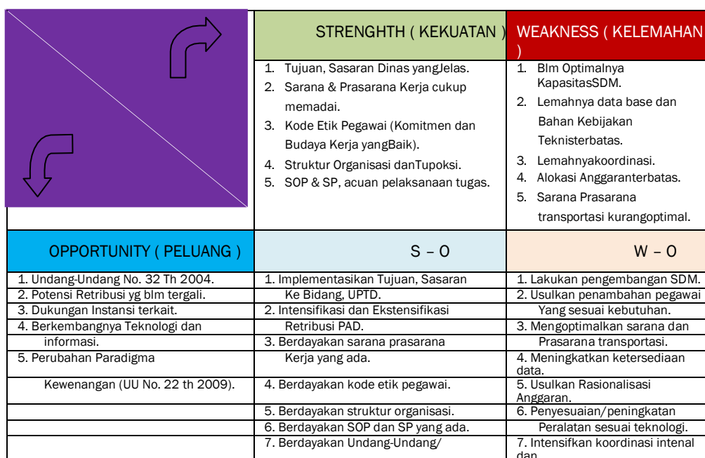
Tabel SWOT Matric

Dari faktor-faktor eksternal (peluang dan ancaman) serta faktor internal (kekuatan dan kelemahan), dilakukan analisa melalui SWOT Matric sebagai berikut :